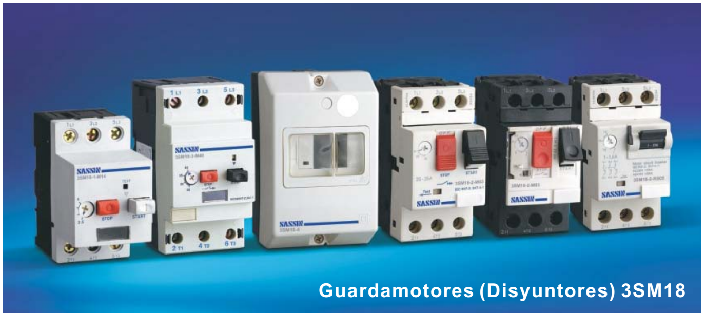
Guardamotores (Disyuntores) 3SM18